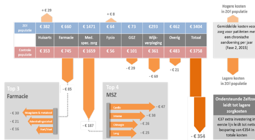
Tabel 1. Zorgkosten chronische zieke patiënten 2015

2015 zijn de zorgkosten in de 'ZO-groep' bij chronische patiënten met ondersteunde zelfzorg €354 (9,4% per patiënt per jaar) lager. Vervolgens zijn de resultaten van deze groep